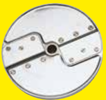
Krájač rezancov 4 x 4 mm Ref. 28052