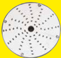
Strúhač 1,5 mm Ref. 28056