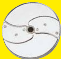
Plátkovač 1 mm Ref. 28062